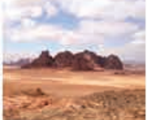
والتنسيق بين الجهات الرسمية، وشهول خدمات الإنتاج والمعدات والنجم التوسني وزيد على كل هذا الترويج للتصوير بالأردن،

على عهه العديد من الرحلات الاستثنائية التي توفرها الهيئة لمن يبحث عن أماكن مميزة منها الإنتاج البريطاني تفيلم "أخر أيام على الريح"، اللندي كونويل، والمسلسل التلفزيوني لفيلم أمريكا "فضايا سيرة"، لإنتاج حقة جديدة في الزمن لسرة التابية، وحلات أخرى مستغرى من بينها الإنتاج البريطاني "القرنة العظيمة" للمخرج بين بروج، فيما الظروف المصيبة تشب دوراً إشاعها في جها بيئة آمنة للصور، خصوصاً في ظل توفر بيئة مثالية ولأمانة وحداوت تجعل منها مثقفة مميزة. وفي "Hyena Road" للمخرج انندي بول غروس، الذي يشاركه في البطولة إلى جانب دوستر سالزالاند، والأن هونو، فيتناول قصة مصممة من الحرب في أفغانستان والعلفة الإنسانية التي تربط الجيش انندي والنشب الأفضاني وصوت مشاهده، في الغيبة والتماق المعصية بها.