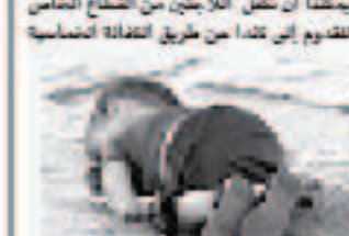
هذه الصورة توثق الوضع البشري في سوريا.

في هذه المرحلة من الزمن، فإنه لا قيمة له بلوغه أصابع الاتهام وإلقاء التوب على الآخرين. ونحن، شأفراد، نعتزم علينا القيام بدورنا في كندا، وعلى الرغم من الصعلة للأطير الذين تم هيرتهم نهاية الآن. يمكن أن تقدم الكثير على بشكل فردي يمكننا أن نكمل الألابن من التشاع التماس لتقديم إلى كندا من طريق التفاهة التماسية الأخرين.